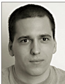
Mgr. Tomáš Zdechovský

základě dlouhodobých sympatií k politické straně či k osobnosti. Proto je třeba se primárně zaměřit na tu 1/4 lidí, kteří se rozhodnou těsně před volbami. Zlaté volební pravidlo zní: Lépe se přesvědčují lidé tam, kde je co nabídnout.