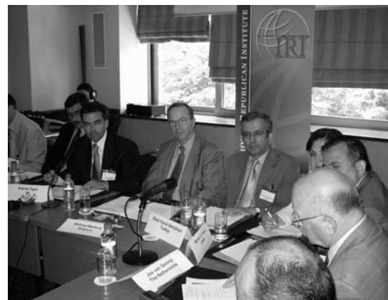
Wilfried Martens, předseda Evropské lidové strany na konferenci v Istanbulu, červen 2006

vymezením pozice pro danou chvíli “, a proto se také proměňují s měnící se historickou situací. V popředí jejich zájmu však není chod dějin, ale „ otázka, jak v jakémkoliv historickém okamžiku žít křesťansky “. Z toho důvodu křesťanská demokracie také nenárokuje konkrétní politickou změnu (neboť tato sama o sobě není samospasitelná) či se nezaměřuje na konkrétní sociální či politickou skupinu. Politická strana též ideově rodiny, která v Itálii reprezentovala homogenní masu katolických voličů (i když okolnostmi byla „ přinucena “ přijmout jinou roli, než kterou původě zamýšlela) není ve stejné situaci, jako její programově nejbližší