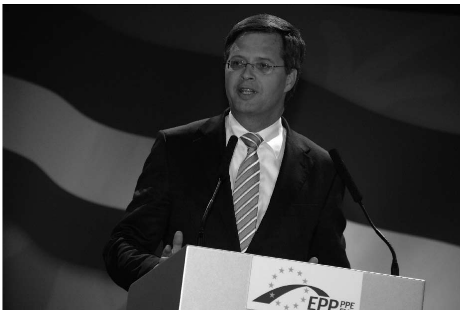
Jan Peter Balkenende, předseda CDA