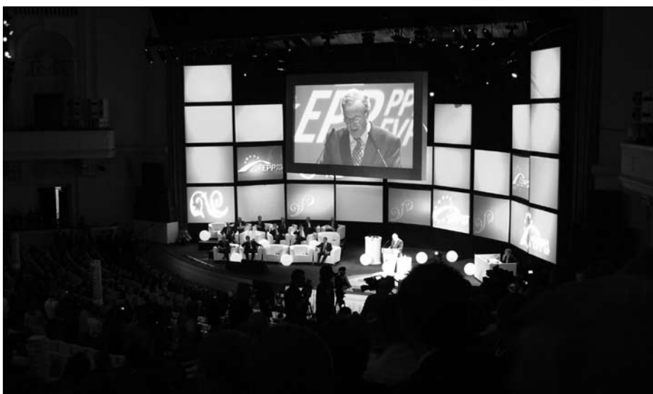
Wilfried Martens, předseda Evropské lidové strany