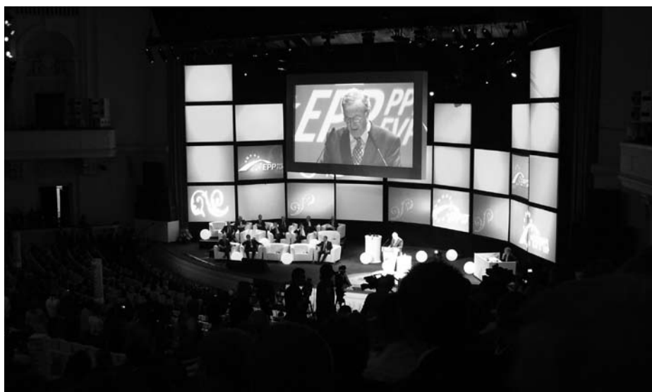
Wilfried Martens, předseda Evropské lidové strany